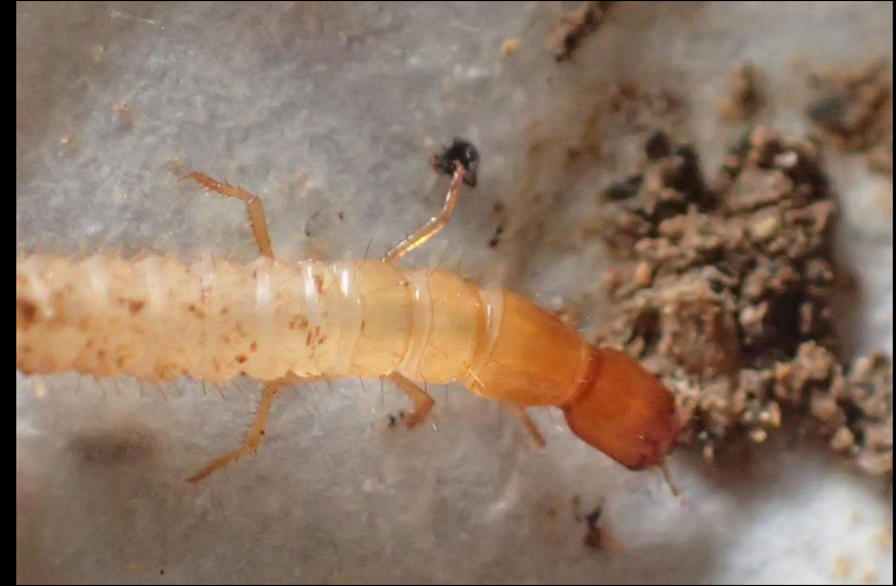
Larve de coléoptère Staphylini? Carabe?

Coléoptère : (du grec : koleos, étui, et ptéron, aile) Aile en étui protecteur qui protègent les ailes de vol