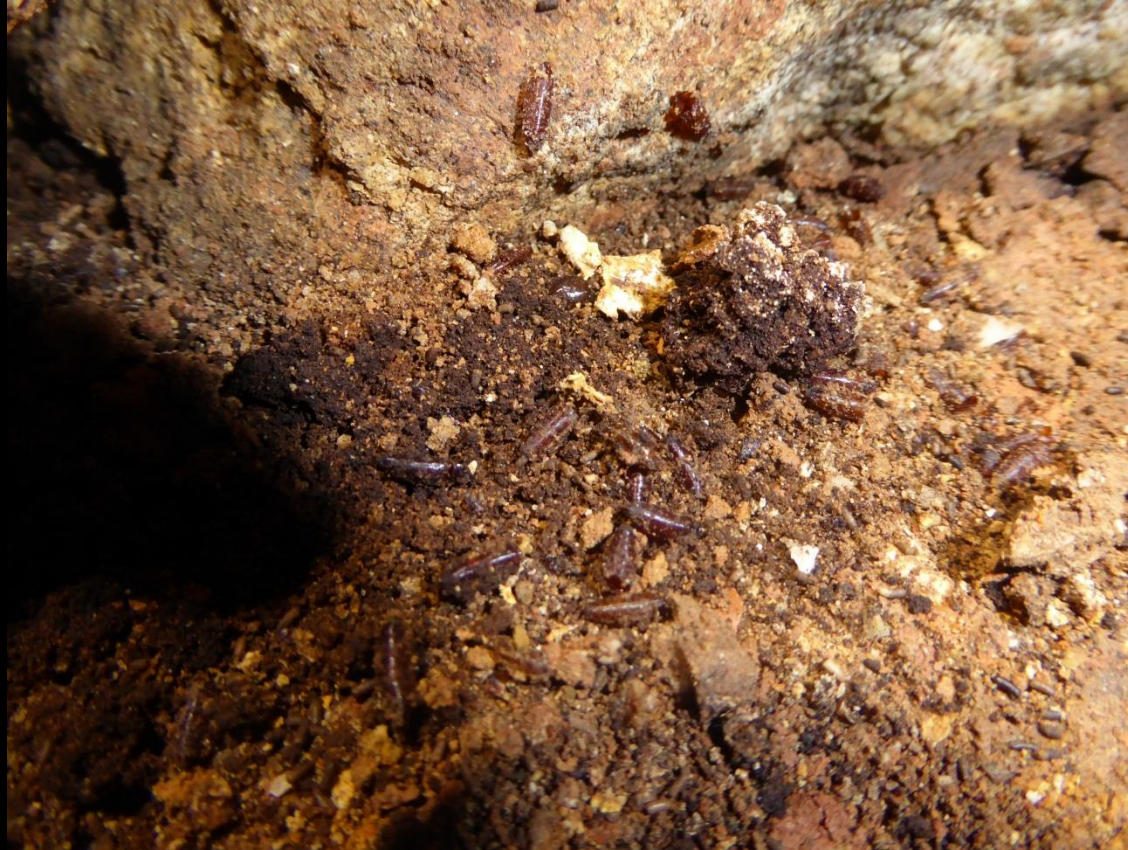
Pupes de diptère