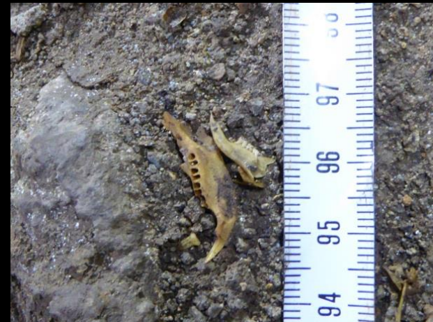
Vieille pelote de rejections